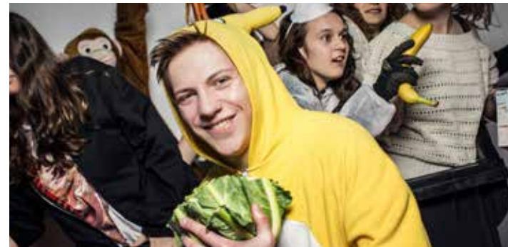
Volkstheatergruppe Erna Von Küken, Ferkeln & Welpen